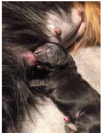
de pup van Zus